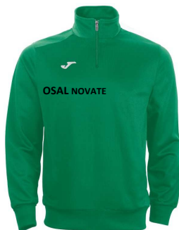
FELPA ALLENAMENTO €19