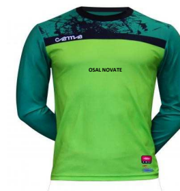
MAGLIA PORTIERE € 25