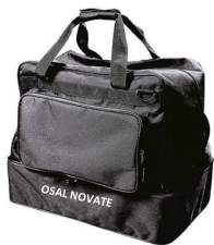
BORSA € 21