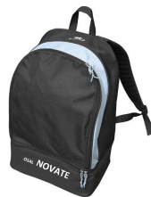
ZAINO € 15