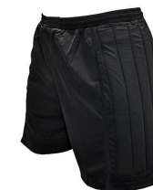
SHORT PORTIERE € 10