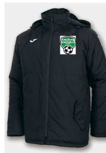
GIACCONE € 42