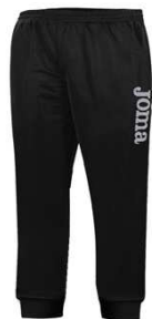
PANTALONE ALLENAMENTO € 14