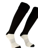
CALZE € 4