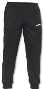
PANTALONE RAPP. € 17