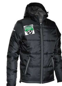
BOMBER € 35