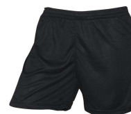
SHORT € 5,5