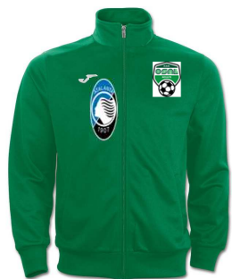
GIACCA RAPP. €19