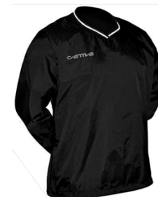
K-WAY € 10