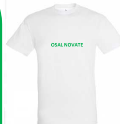
T-SHIRT € 6